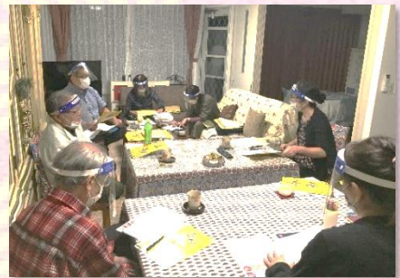
フェイスシールドを付けて会議中

さらに、コロナ禍の中、安心して楽しんでいただけるよう、今回はオンラインでも配信を企画！新しい表現方法でもお楽しみいただけます。「第4回西の都 秋の彩祭 太宰府音楽祭」は、表現者ひとりひとりの力を繋ぎながら、市民の力で作られる音楽祭です。会場で一緒に楽しみませんか！