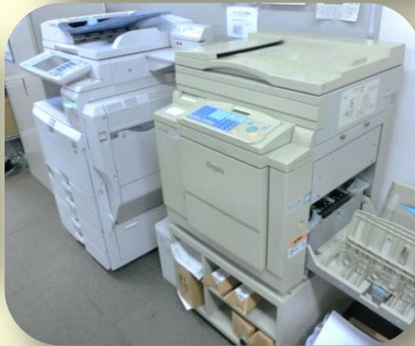
コピー機・印刷機