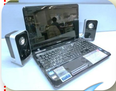
パソコン・スピーカー