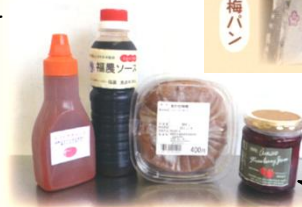
生徒さんが開発した商品の一部